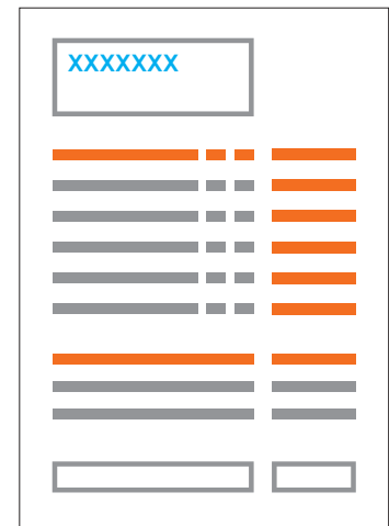
Nummerierung der Sätze

Wenn Sie die Rückseite bedrucken lassen möchten, legen Sie dies in der Druckdatei bitte in schwarz an. Um ein Durchscheinen zu vermeiden erfolgt der Druck auf der Rückseite jedoch in HKS 96 (grau).